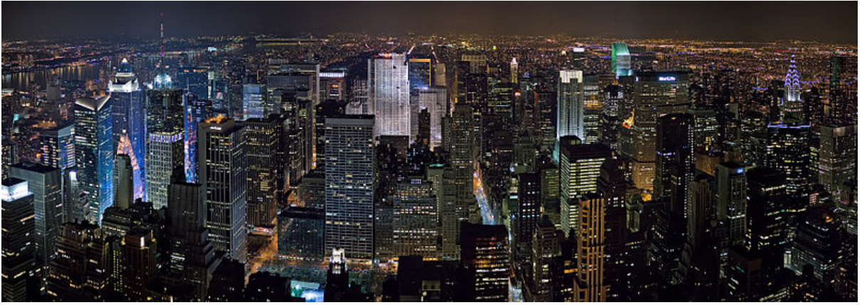
Canlıların irade ve ihtiyarlarına örnek teşkil edecek, yüksek binalarla kaplı, göz kamaştırıcı bir şehir [3]

“İnsan ne zaman bir işini Allah’dan gayriye havale ve itimat etse, bu teslimiyeti onun bela, mihnet ve zilletine sebep olur. Lakin Allah’a itimat edip, halktan kimseyi bulaştırmazsa, muradı en güzel şekilde hasıl olur. Evvel ömrümden bu güne kadar, bu tecrübe bana kafi gelmiştir. Elli yaşındayım, insan için Hak Teala’nın kerem ve ihsanından gayrı bir şeye itimat etmemek ve Mevla’nın gayrından fayda beklememek, tamamıyla kalbime yerleşmiştir.” [1]